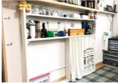
カーテンを付けてWiFiルーターなどを目隠しに