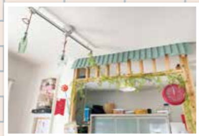
海外のカフェ風にキッチン周りをアレンジ