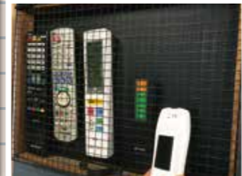
裏側にマジックテープを付けて壁に固定すればリモコンの迷子も防止できます