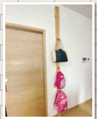
2x4の板材を1枚ディアウォールで設置してフックを設置するだけ!