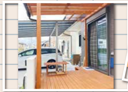
本格的なウッドデッキとテラス