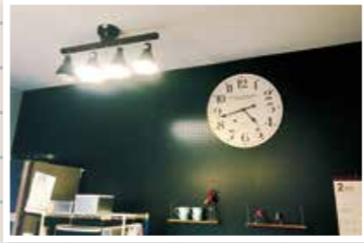
専用のフックを付けると、飾ったり、掛けて収納もできる万能な有孔ボード