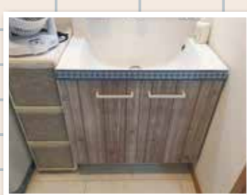
カットニングシートを使っている場所をオリジナルアレンジ