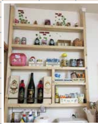
270cmの天井高の上部空間を上手く活用